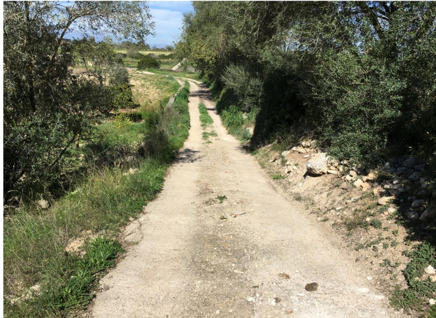
Vista del camino